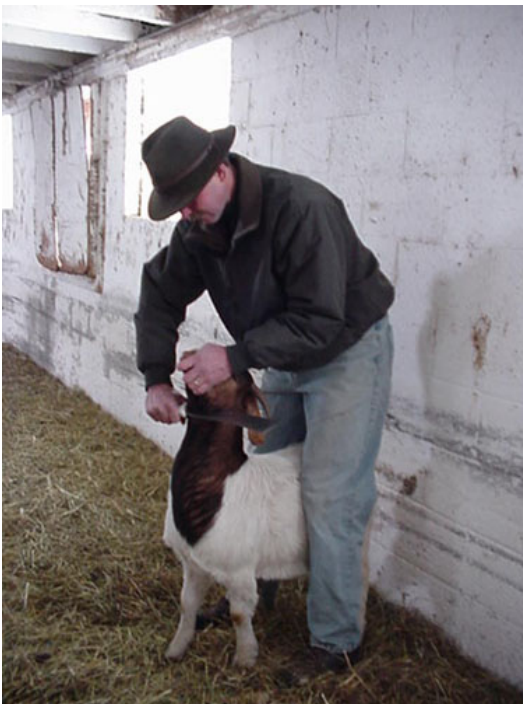
Als de slager alleen is en het dier tam, kan het geslacht worden door in spreidstand over het dier te gaan staan. De muur voorkomt dat het dier achteruit kan bewegen.